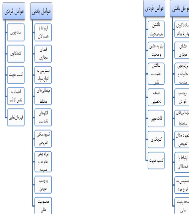
نمودار ۱. عوامل فردی و بافتی مؤثر بر گرایش نوجوانان پسر به رفتارهای پرخطر